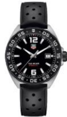
TAG Heuer Formula 1 WAZ1119.FT8023